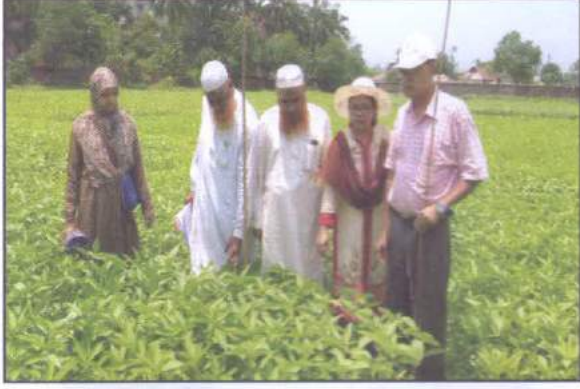
অতিরিক্ত পরিচালক মহোদয় সহ পাট ফসলের ডিইউএস প্রট পরিদর্শন