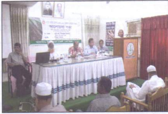
বীজ প্রত্যয়ন এজেন্সীর সদর দপ্তর ও আঞ্চলিক বীজ প্রত্যয়ন অফিস, ঢাকার সমন্বয়ে বোরো হাইব্রিড ট্রায়াল/ ২০১৫-১৬ বাস্তবায়ন ও মূল্যায়ন বিষয়ক আলোচনা অনুষ্ঠান আয়োজন