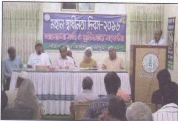
বীজ প্রত্যয়ন এজেন্সীতে মহান স্বাধীনতা দিবস/২০১৬ উদ্‌যাপন।