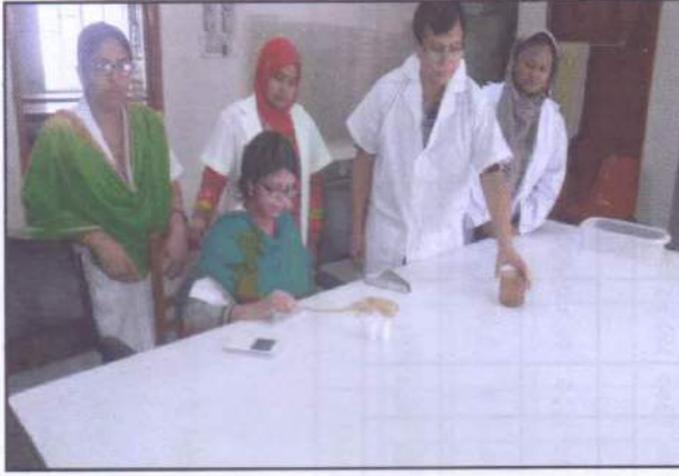
অঙ্কুরোদগম পরীক্ষার প্রস্তুতি মূলক কার্যক্রম