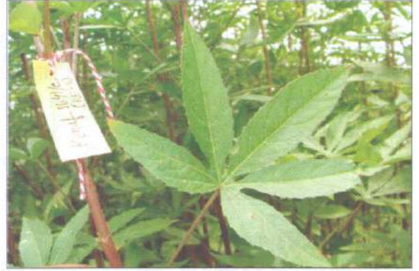
কেনাফের ডিইউএস টেস্ট