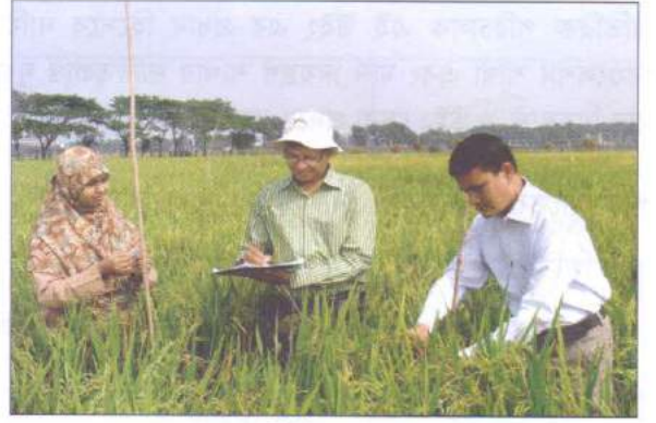
রোপা আমন ধানের ডিইউএস টেস্ট এর তথ্য সংগ্রহ