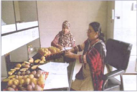
আলুর (টিউবার) ডিইউএস টেস্ট এর তথ্য সংগ্রহ