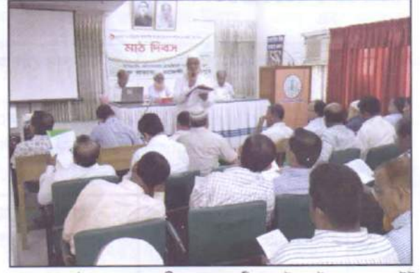
২০১৫-১৬ মৌসুমের বোরো বীজ ফসলের প্রি-পোস্ট কন্ট্রোল ও গ্রো-আউট টেস্ট বিষয়ক মাঠ দিবস অনুষ্ঠান।