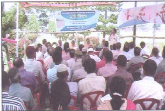
২০১৫-১৬ মৌসুমের আমন বীজ ফসলের প্রি-পোস্ট কন্ট্রোল ও গ্রো-আউট টেস্ট বিষয়ক মাঠ দিবস অনুষ্ঠান