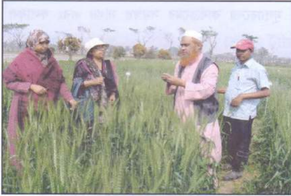
অতিরিক্ত পরিচালক মহোদয়ের গমের ডিইউএস টেস্ট প্লট পরিদর্শন