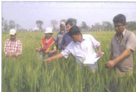
গমের ডিইউএস টেস্ট এর তথ্য সংগ্রহ