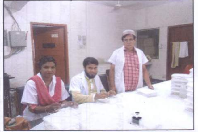
বীজের অঙ্কুরোদগম পরীক্ষা শাখার কার্যক্রম