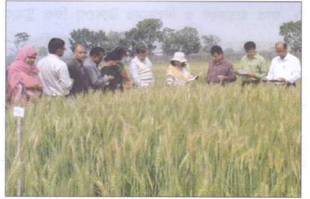
গমের মাট দিবস অনুষ্ঠানের সরকারি ও বেসরকারি প্রতিষ্ঠানের প্রতিনিধিগণের অংশ গ্রহণ