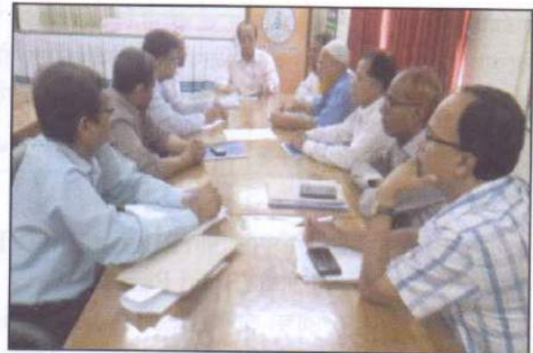
পরিচালক, বীজ প্রত্যয়ন এজেন্সীর সাথে ০৭টি অঞ্চলের, আঞ্চলিক বীজ প্রত্যয়ন অফিসারবৃন্দের বার্ষিক কর্মসম্পাদন চুক্তি স্বাক্ষর