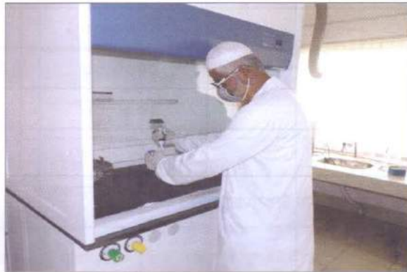
জাত পরীক্ষাগারে ডিএনএ ফিঙ্গার প্রিন্টিং কার্যক্রম