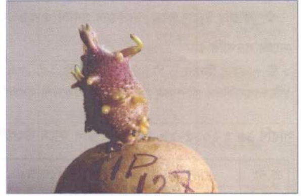
আলুর স্প্রাউট টেস্ট