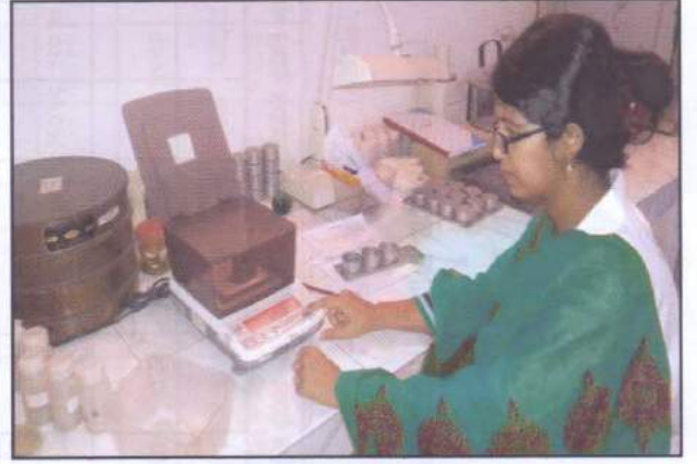
বীজের আর্দ্রতা পরীক্ষা শাখার কার্যক্রম