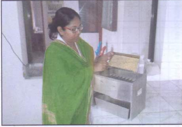
কেন্দ্রীয় বীজ পরীক্ষাগারে কার্যকরী নমুনা প্রস্তুতকরণ