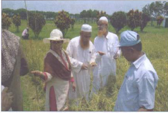
বোরো ধানের জাতের কৌলিক বিশুদ্ধতা যাচাই করছেন সংস্থার কর্মকর্তাবৃন্দ