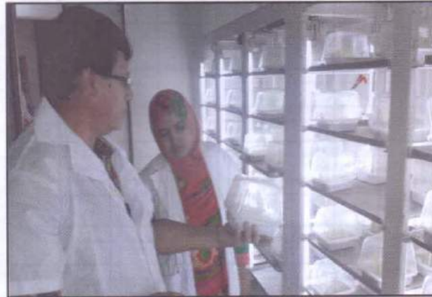
বীজ পরীক্ষাগারে ওয়াকিং জার্মিনেটে চারার অবস্থা পর্যবেক্ষণ