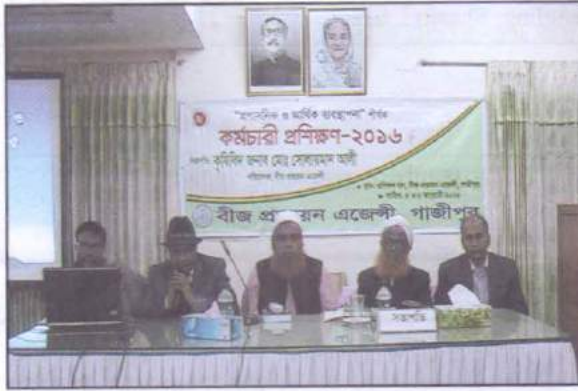
“প্রশাসনিক ও আর্থিক ব্যবস্থাপনা” শীর্ষক কর্মচারী প্রশিক্ষণে বক্তব্য রাখছেন বীজ প্রত্যয়ন এজেন্সীর কর্মকর্তাবৃন্দ